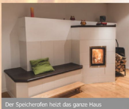
Der Speicherofen heizt das ganze Haus